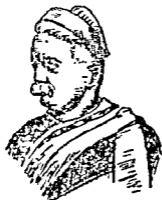
महादेव गोविन्द रानडे

हो रहे थे, उन्हींके फलस्वरूप प्रार्थना-समाज का भी प्रादुर्भाव हुआ। 'प्रार्थना-समाज' के नामकरण से पूर्व 'परमहंस मंडली' के नाम से कुछ व्यक्ति अप्रकट रीति से धर्म, समाज और जाति-सम्बन्धी सुधार का कार्य करते थे। इनका विशेष कार्य उस समय जांत-पांत के नियम तोड़ने का था। किन्तु ब्रह्म-समाज, रामकृष्ण-मिशन इत्यादि के प्रभाव और सामाजिक व धार्मिक चेतना के साथ महादेव गोविन्द रानडे तथा भंडारकर जैसे व्यक्तियों ने खुली रीति से कार्य करने का निश्चय